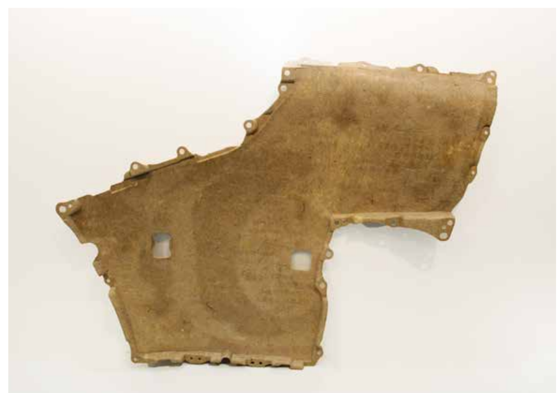
ドアトリム基材 Door trim base material

Heat-expandable microcapsules fill the gaps in the fibers formed in molding of the material to maintain rigidity equivalent to that of conventional materials.