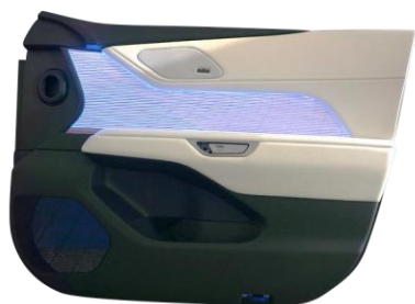
イルミネーションの一例