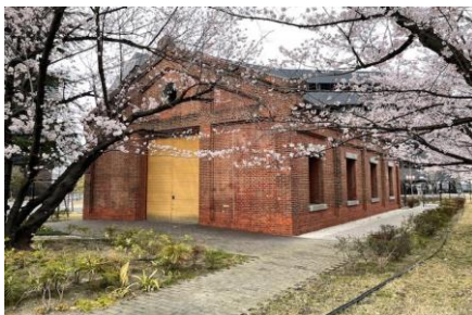
レンガづくりの建物