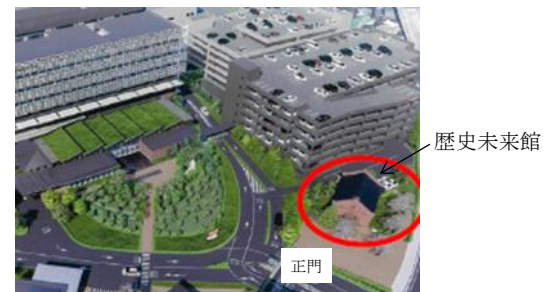
刈谷本社の正門に向かって 右側にあるレンガ造りの建物