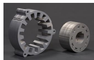
ハイブリッドシステム用モーターコア (独自の高精度・高速プレス加工技術で、モーターコアの生産を担当)

ハイブリッドシステム用モーターコア、 ドアトリム、天井、エアクリナー、 キャビンエアフィルター、 オイルフィルター など