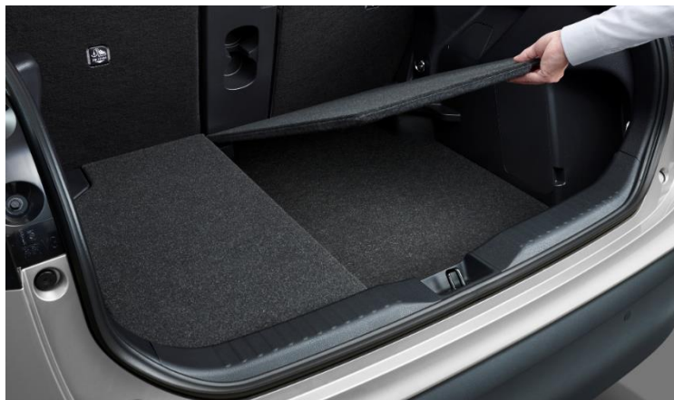
6：4分割開閉イメージ

載せる荷物の高さに応じて荷室床面の高さを2段階で調節でき、また左右を6：4で分割可能なデッキボードを開発。また、4：2：4分割可倒式リヤシートと組み合わせることで、さらに多彩なアレンジが可能。コンパクトSUVとしての荷物スペースの使い勝手向上に寄与しています。