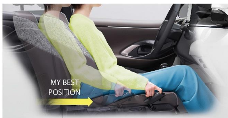
運転席イージーリターン機能