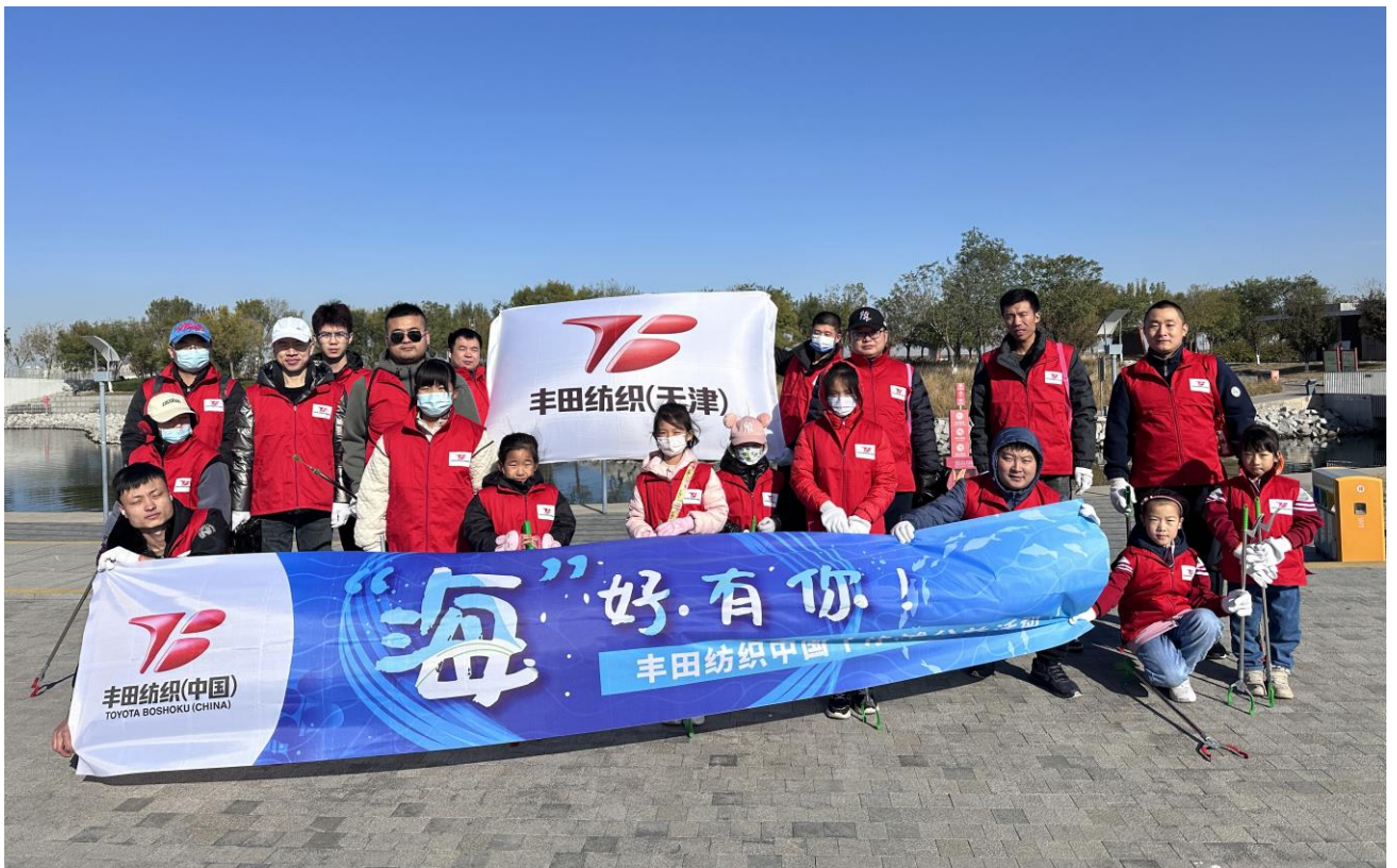
丰田纺织(天津)汽车部件有限公司