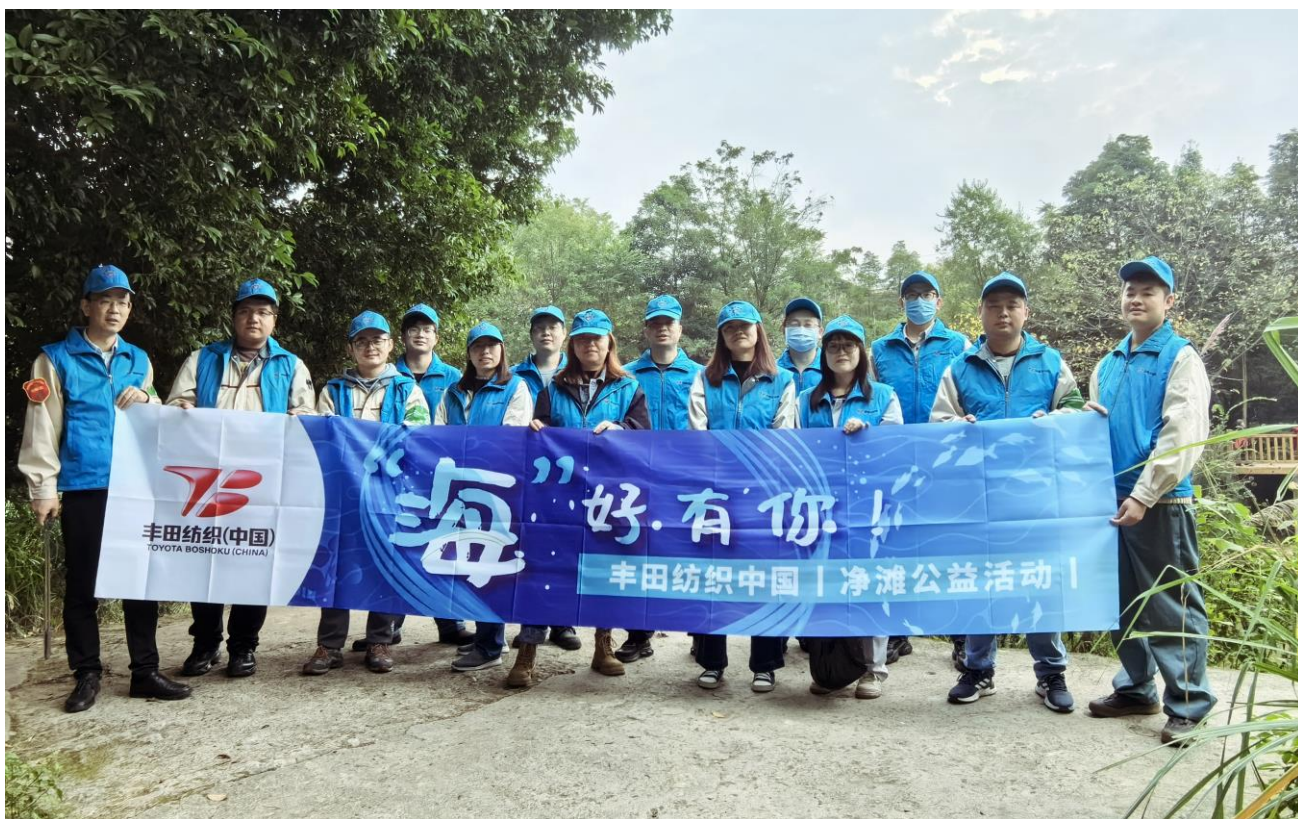
成都丰田纺汽车部件有限公司

丰田纺织（中国）有限公司始终秉承可持续发展的理念，通过企业生产和经营的各环节为中国社会做贡献。在这一方针指引下，丰田纺织（中国）有限公司确立了“环境保护”“人才培养”“产业贡献”三个可持续发展战略品牌，连续多年开展公益活动，回报中国社会。