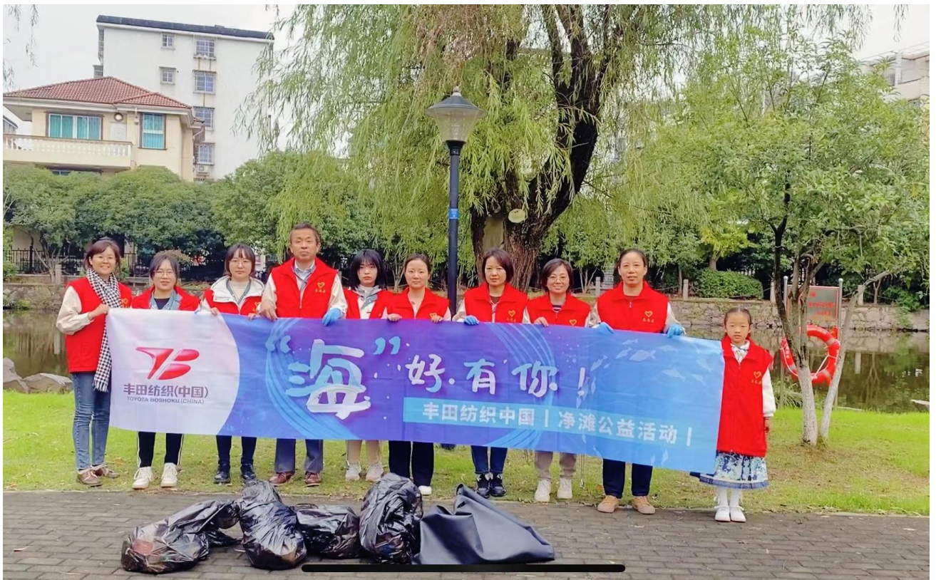
宁波丰田纺织汽车部件有限公司