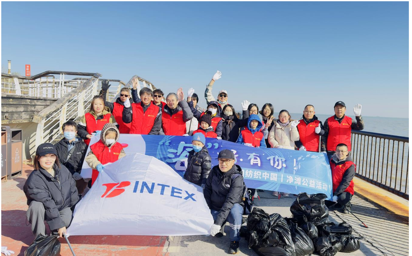
天津英泰汽车饰件有限公司